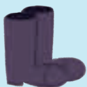
die Gummi- stiefel