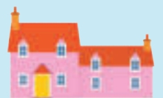
das Bauern- haus